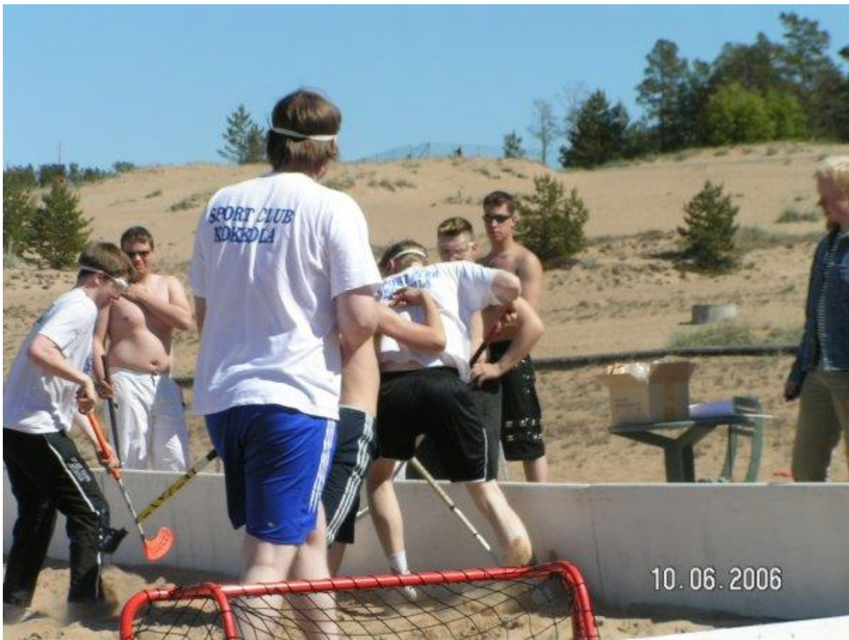
Hiekkasählyssäkin Kalajoella SC Kokkola on pelaillut muutaman kerran, ensimmäisen kerran 2006.