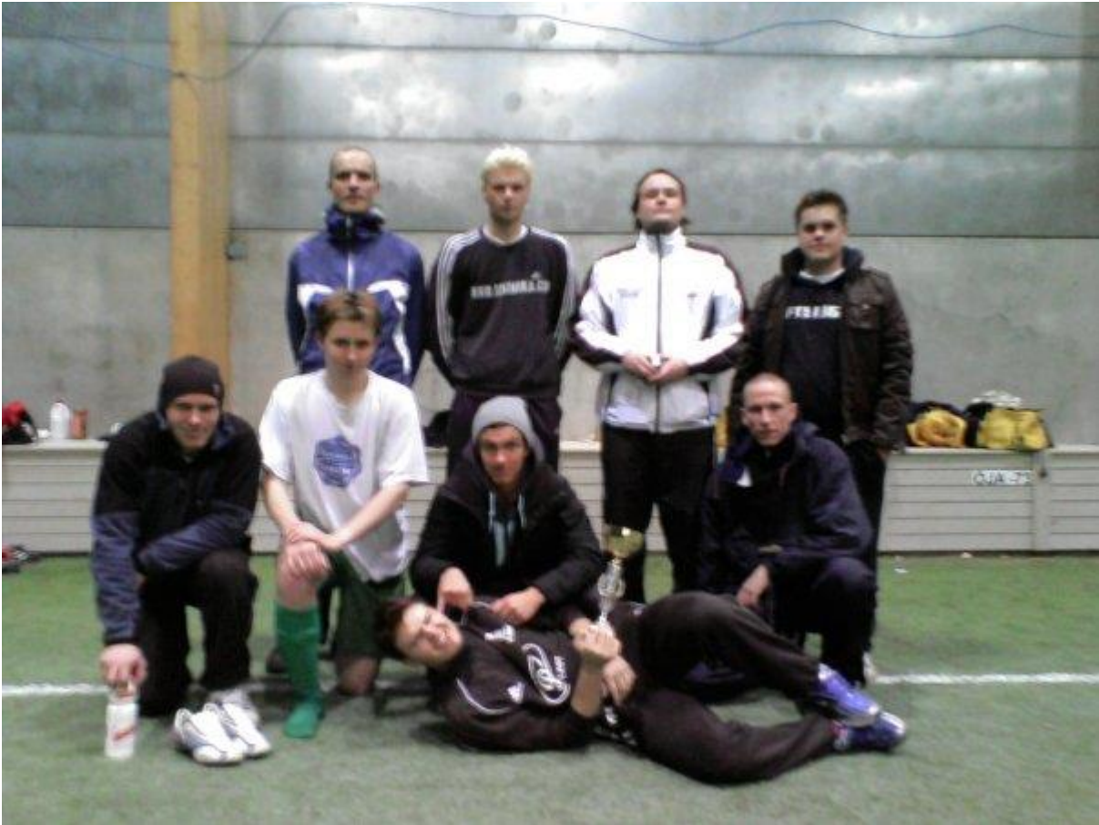
Intersport jalkapalloturnaus 2006 (Hopealle)

SC Kokkolan salibandymiehet olivat myös näihin aikoihin ahkeria turnaukskävijöitä. Tutuksi tulivat useat lajit.