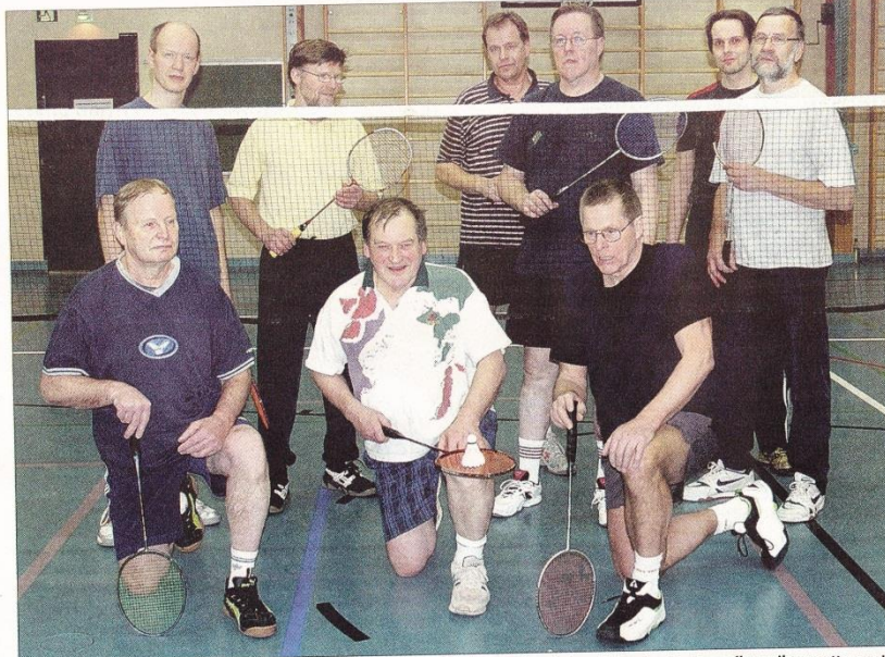
Tämä porukka on kokoontunut jo yli 25 vuoden ajan nauttimaan sulkapallon iloista. Toki ryhmässä on ollut vaihtuvuutta, mutta koko ajan mukana olleita löytyy.

– Tänne on aina mukava tulla. Alkuun tärkeää oli kova tempo ja se, että sai