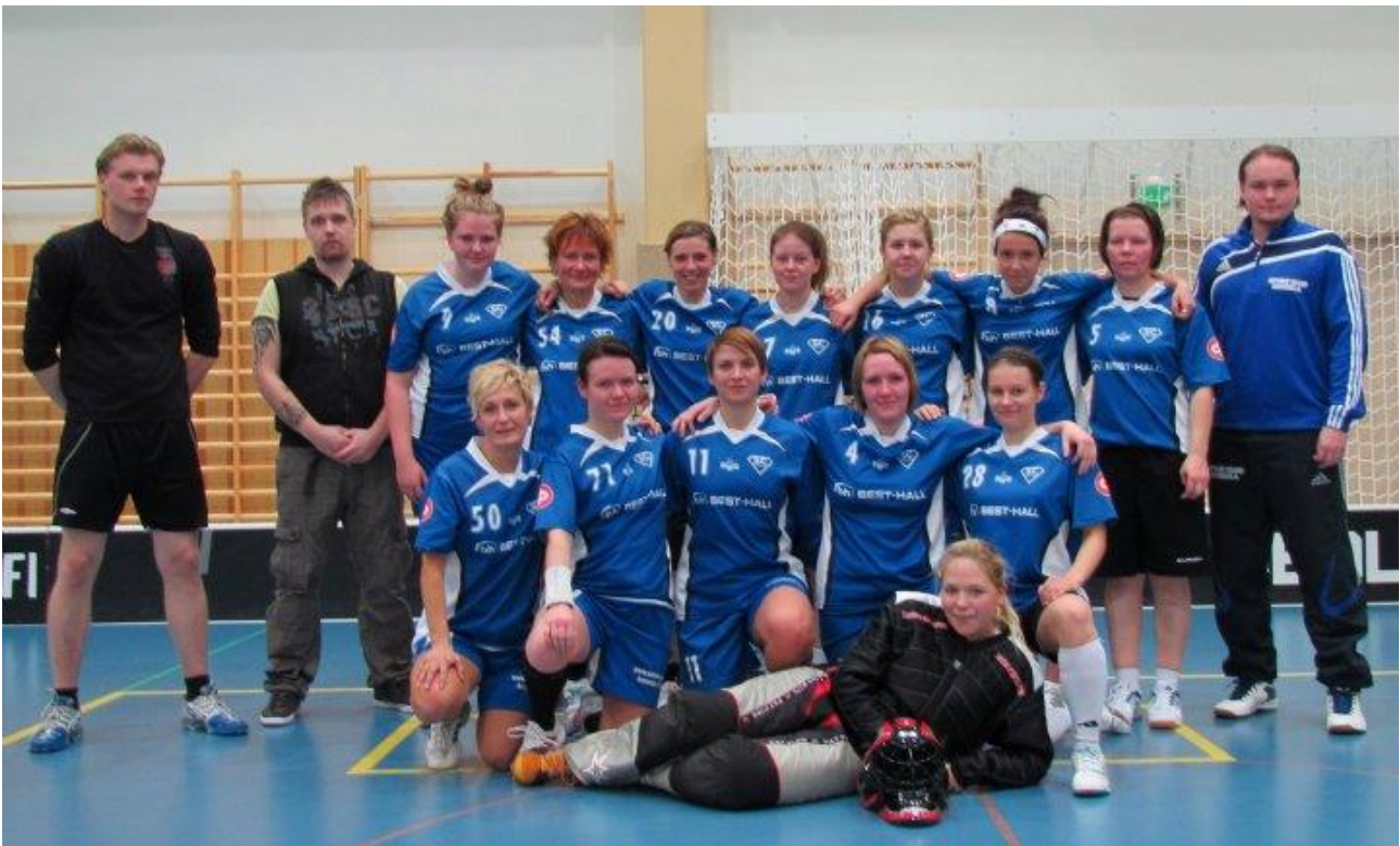
SC Kokkolan salibandynaiset 2012