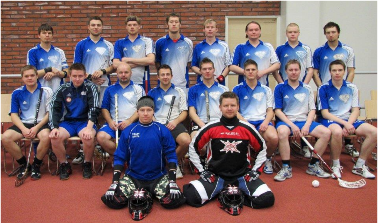
SC Kokkolan salibandymiehet 2012