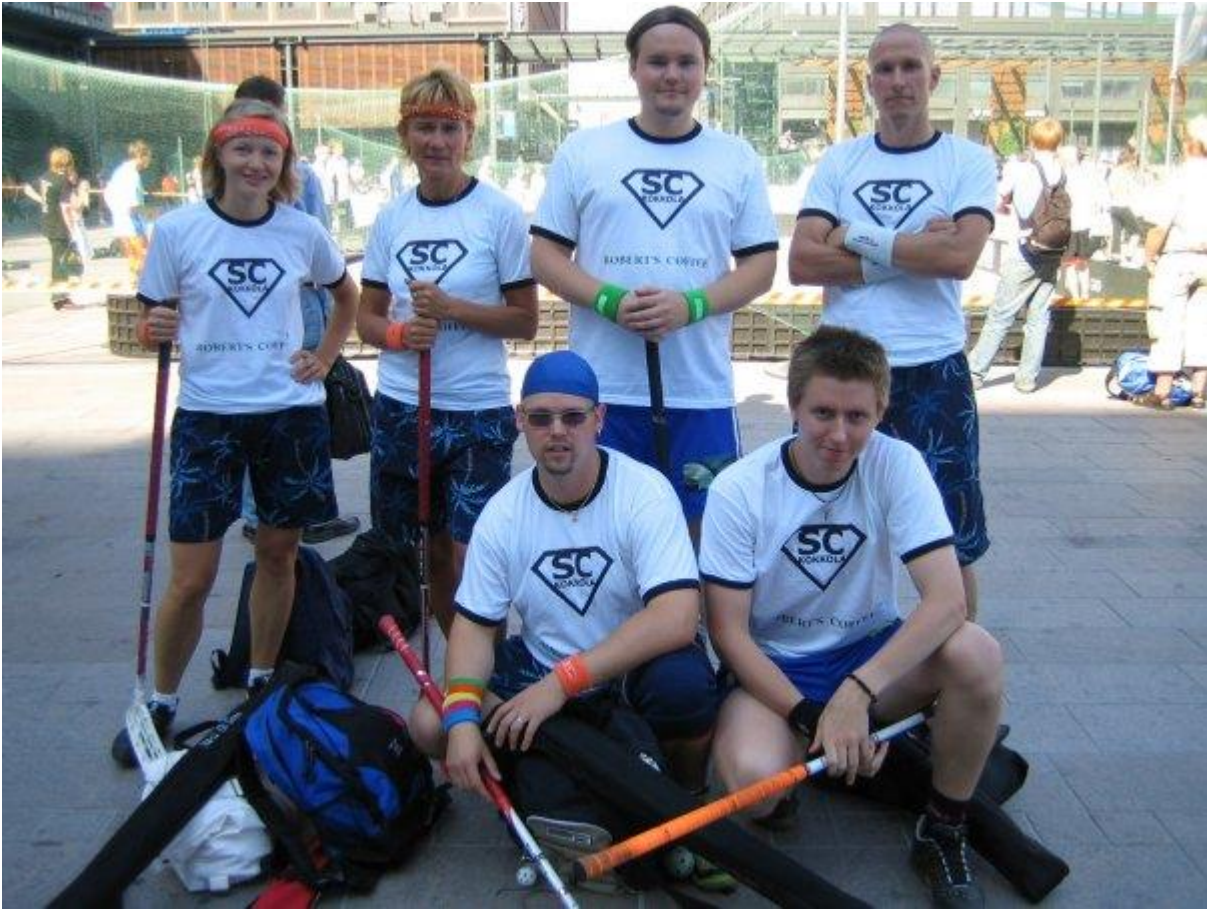
Helsingissä katusählyn SM-Finaalissa sekasarjassa.